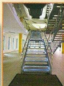
L'éclairage naturel assuré par l'installation de grandes verrières en toiture