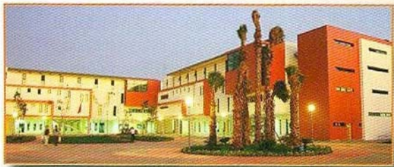
Depuis la cour intérieure, on peut observer le jeu esthétique des façades qui apporte la lumière nécessaire au travail des étudiants.

On peut observer que toutes les classes s'ouvrent directement sur l'extérieur et toutes les circulations horizontales et verticales sont éclairées naturellement.